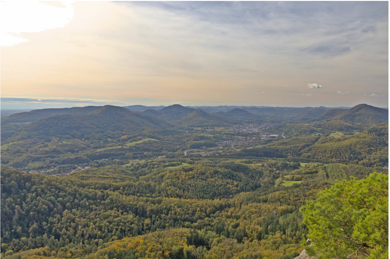
Auf dem Weg zur Burg Neuscharfeneck